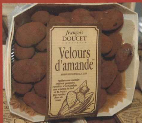
Un nom qui chante.