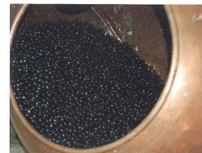
Le berceau des olives.

Pendant toutes ces années de créativité, le souvenir le plus émouvant que nous avons connu, c'est notre premier Ruban Bleu à Intersuc. Un très grand plaisir : l'arrivée dans la grande notoriété du métier. Nous