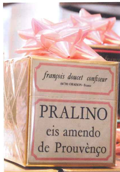
Les « Pralino » de toujours.

Nous avons des amis qui avaient une plantation d'abricots orangés de Provence. Une variété authentique, remarquable, qui poussait dans les coteaux, à 800 mètres d'altitude. Ils avaient un goût extraordinaire. Mon expérience d'Auvergne m'est revenue pour utiliser ces abricots exceptionnels. C'est comme cela que nous avons élaboré des pâtes de fruits aux abricots de Provence. C'était une bonne base. Nous avons rajouté de la présentation en les glaçant. C'est plus joli. C'est à Intersuc que j'ai eu l'idée. Il y a 50 % d'abricot et 50 % d'un autre fruit. Au début nous avons cinq sortes : Abricot, Poire, Fraise, Framboise et Mandarine.